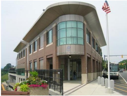
BRTA Intermodal Transit Center, One Columbus Avenue, Pittsfield, MA